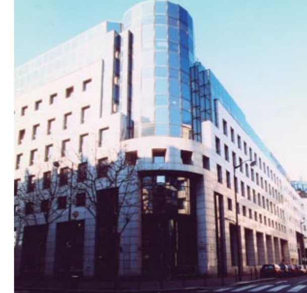
■ Paris Bercy, Ilot Mazas Revêtement - 12 000 m 2